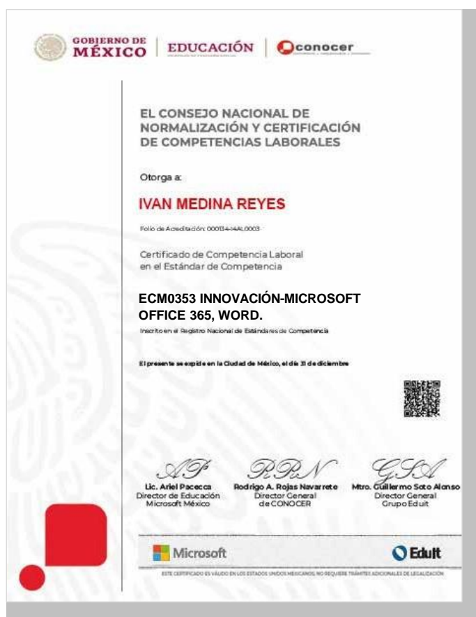
MUESTRA DEL CERTIFICADO